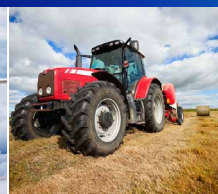
СЕЛЬСКО-ХОЗЯЙСТВЕННАЯ И ВНЕДОРОЖНАЯ ТЕХНИКА