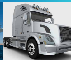
ГРУЗОВИКИ И АВТОБУСЫ